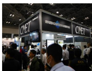
展示ブースの様子②